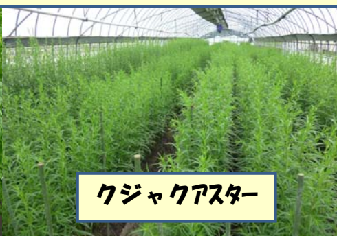
クジャクアスター